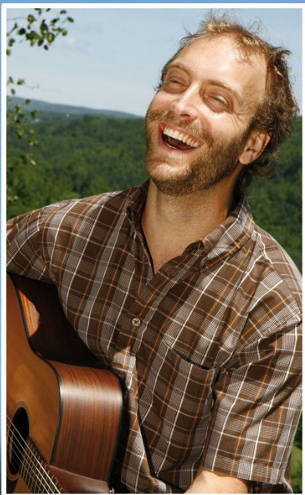
GUITARE, BOUZOUKI, PIEDS ET RÉPONSES